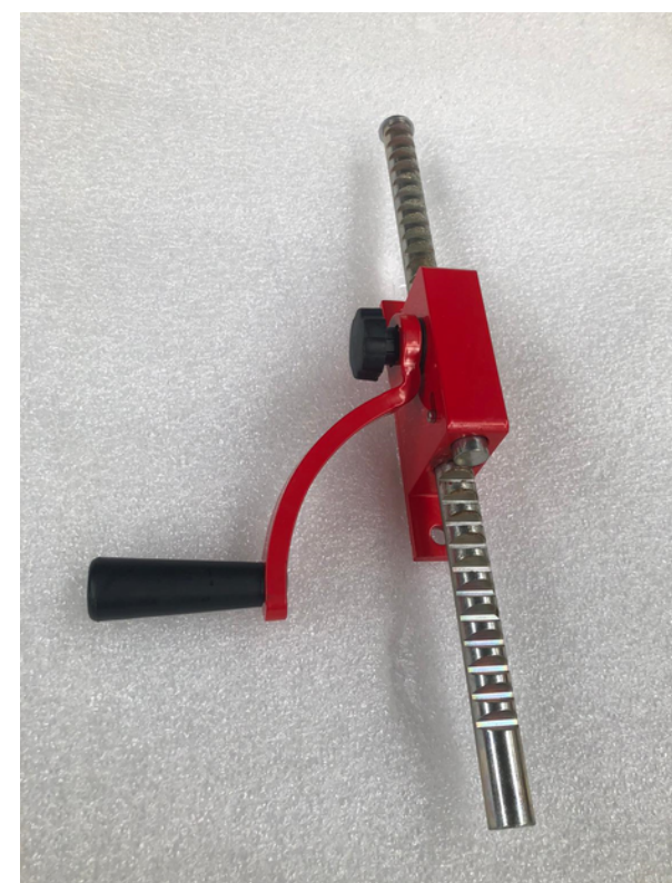
Treuil à crémaillère V0509