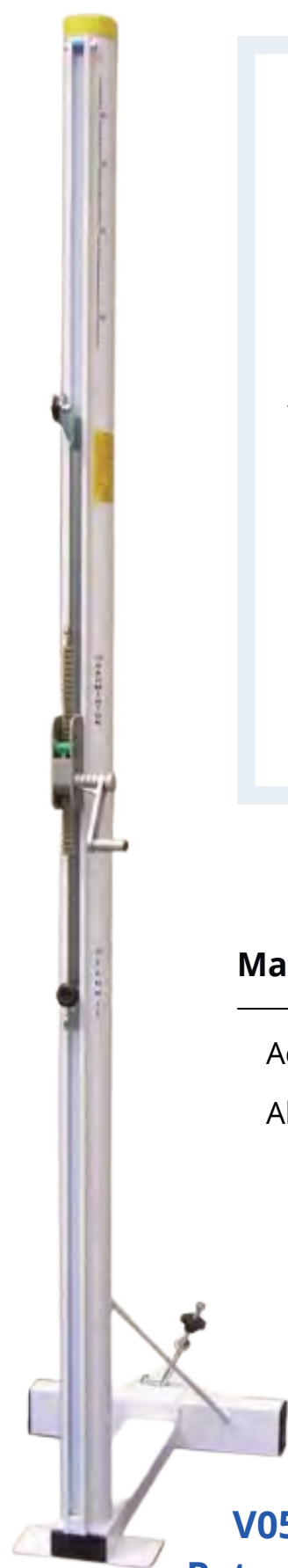
V0571 Poteau sur embases