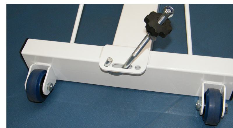
Embase à roulettes