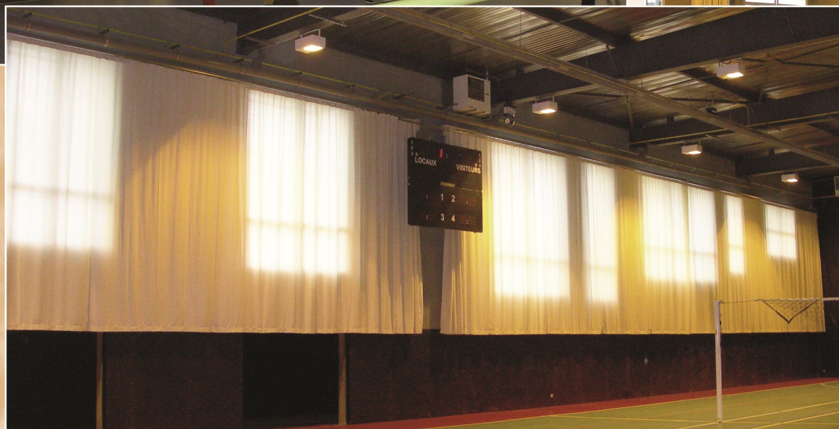
OCCULTATION BRISE VUE