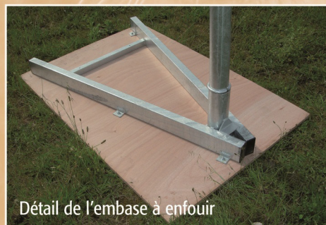
Détail de l'embase à enfouir